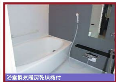
浴室換気暖房乾燥機付