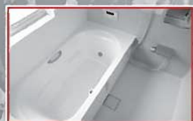
一階タイプ、新品のお風呂です。一日の疲れをスッキリ解消!!

4LDK ○土地面積/180.76㎡(54.67坪) ○建物面積/111.79㎡(33.74坪)