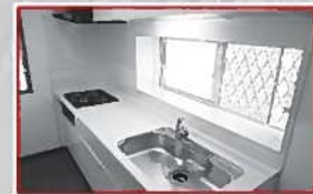
キッチンが新品交換!! 綺麗なキッチンでお料理も楽しく!!