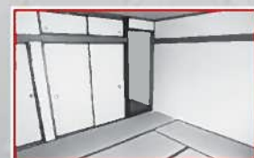
2階和室は落ち着いた和の空間。 お布団派の方にはピッタリ!!

カーナビご利用の方は下記の住所又はマップコードをご入力ください 小山市中久喜4-9-21 マップコード 71 250 473*07