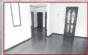
14.5帖のリビングダイニングです。南向き、光の差しこむ明るい空間!!