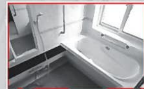
1.25坪のお風呂は、大人でも足を伸ばしてゆったり浸かれます。