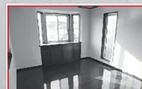
2階、10帖の主寝室です。 こちらからバルコニーへとつづいています。

カーナビご利用の方は下記の住所又はマップコードをご入力ください 栃木市大平町西水代3513-5 マップコード 64 535 112*17