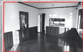
18帖のリビングは陽当り良好!! 家族が集まる明るい空間です。

ご勤続年数、年収により条件が異なってくる場合がございます。諸経費等が別途必要となります。《借入可能》平成30年1月1日現在の金利です。