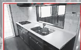
キッチンは食洗機付き!! 面倒な洗い物もまるっと片付きます!!

4LDK+S ○土地面積/241.24㎡(72.97坪) ○建物面積/125.09㎡(37.76坪)